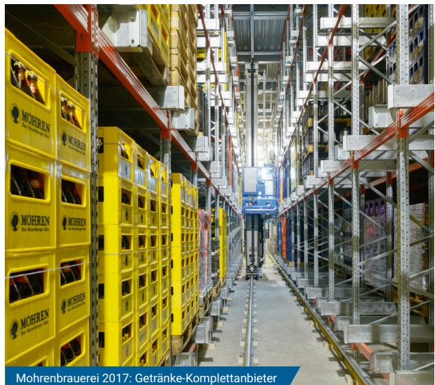
Mohrenbrauerei 2017: Getränke-Komplettanbieter