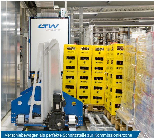
Verschiebewagen als perfekte Schnittstelle zur Kommissionierzone

Dessen zweigeschossige Struktur mit einer sieben und einer neun Meter hohen Regalgasse ist durch den bestehenden Baukörper vorgegeben. Zusätzlichen Raum bringt die Errichtung einer neuen Kommissionierzone auf dem Flugdach der angrenzenden LKW-Versandhalle