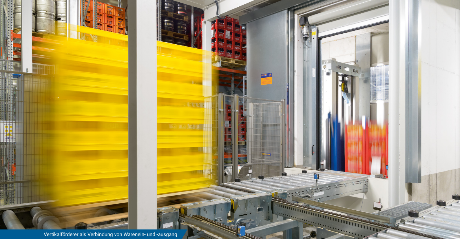
Vertikalförderer als Verbindung von Warein- und -ausgang